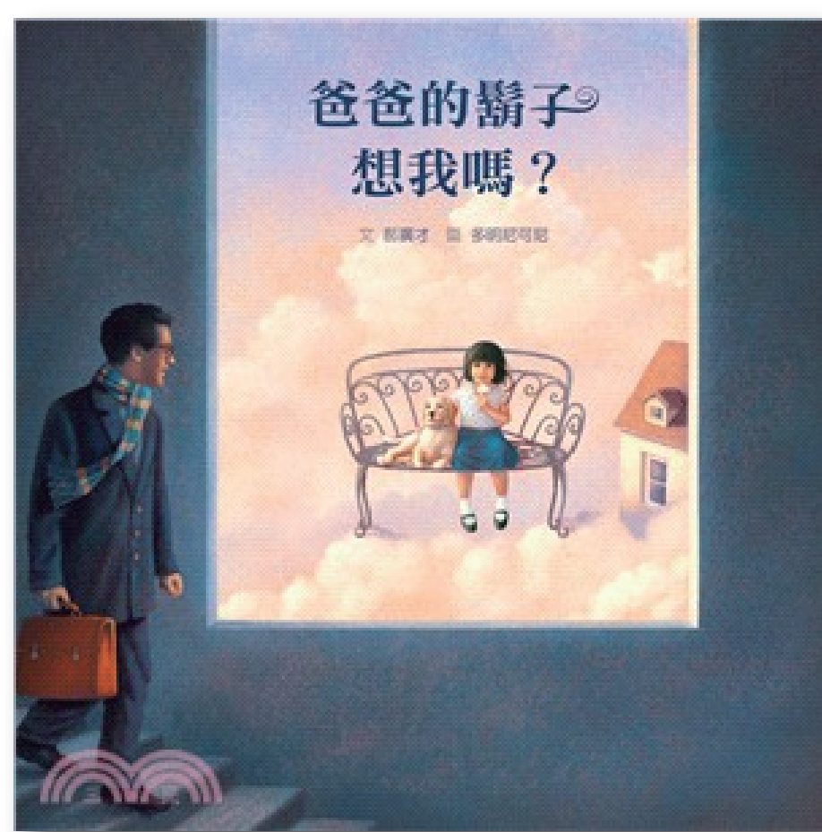
爸爸的鬍子想我嗎？